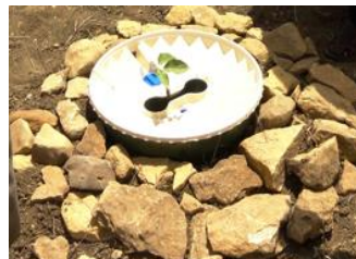
27. Se você tiver pedras disponíveis, cubra o chão