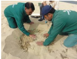
21. Você cobre as plantas com areia - coloque a tampa anti-evaporação - não use seu pé para compactar o solo que você faz com água mais tarde