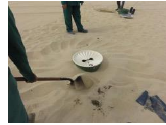
24. Coloque areia ao redor da caixa