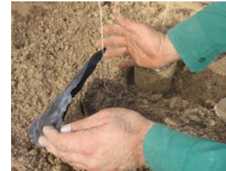
19. Enquanto plantar retire o plástico