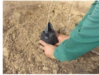
18. Você coloca a árvore com o saco e tira a bolsa