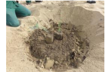
20. Você coloca as raízes das plantas todo o caminho na areia - nesta foto são plantadas acima - nesta foto são plantadas acima da areia, isso é errado