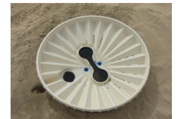
30. Em seguida, encha o Groasis Waterboxx® com 16 litros (4 galões) de água