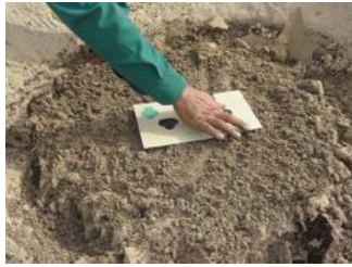
16. Coloque a tampa anti-evaporação em uma direção leste-oeste