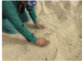
22. Adicione 10 cm (4 polegadas) de solo somente na tampa anti-evaporação antes de colocar o Waterboxx®