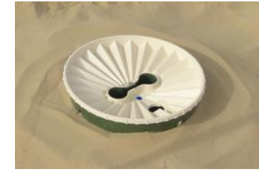
25. Coloque o transbordamento logo acima do solo