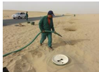
28. Então você começa a dar água