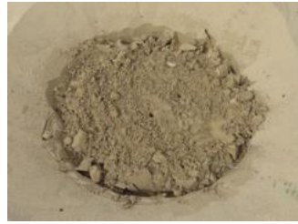
17. Determine o desenho da distância de plantação em uma direção leste-oeste