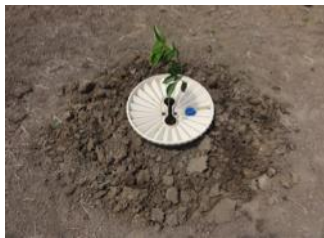
26. Faça soltar o solo ao redor da caixa para matar a grama e trancar a água capilar